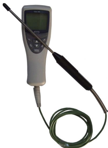
Cod. 08.0000.98 Termometro completo con sensore