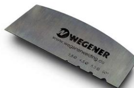
Cod. 08.0000.03 Raschiatore a lama