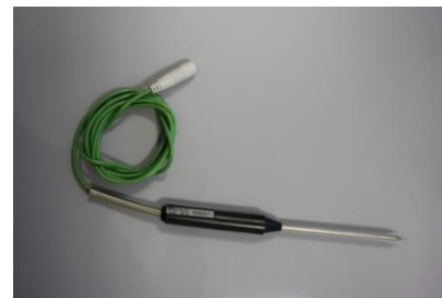
Cod.08.0000.31 Sensore aria calda term digitale 6pin