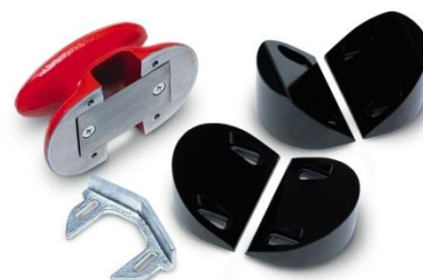
Cod. 08.0000.02 Coltello sbavatore