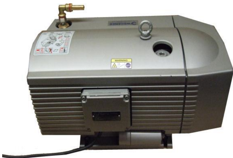
Cod. 08.0000.26 Soffiante