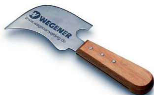
Cod. 08.0000.01 Coltello a mezza luna