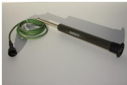
Cod. 08.0000.07 Sensore superficie a contatto per term. digitale (serve adattatore da 4 a 6 pin)