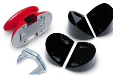
Cod. 08.0000.02 Coltello sbavatore