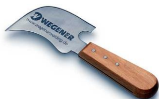
Cod. 08.0000.01 Coltello a mezza luna