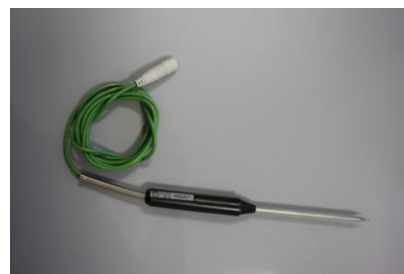
Cod.08.0000.31 Sensore aria calda term digitale 6pin