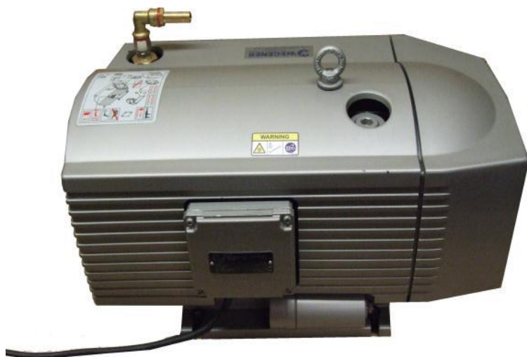
Cod. 08.0000.26 Soffiante