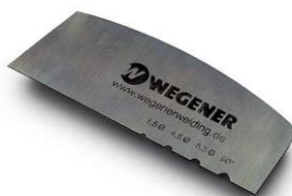
Cod. 08.0000.03 Raschiatore a lama