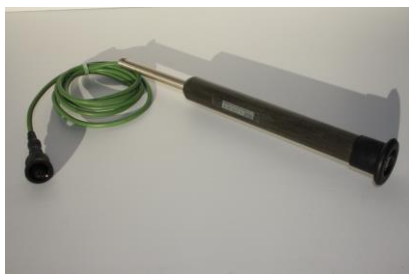
Cod. 08.0000.07 Sensore superficie a contatto per term. digitale (serve adattatore da 4 a 6 pin)