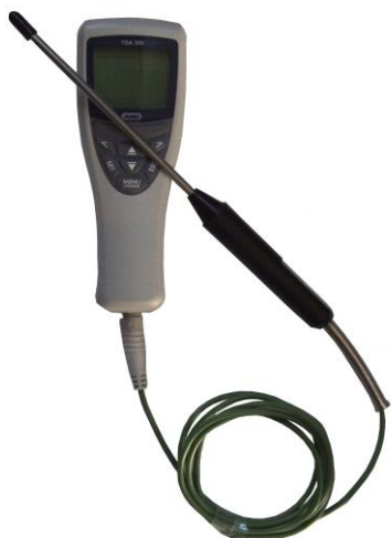
Cod. 08.0000.98 Termometro completo con sensore